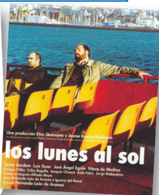
Cartel de Los lunes al sol , película que trata sobre el problema del desempleo

(En La población activa y el paro , de Juan Velarde Fuertes. Abc. 17-6-2001)