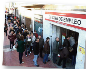
Oficina de empleo